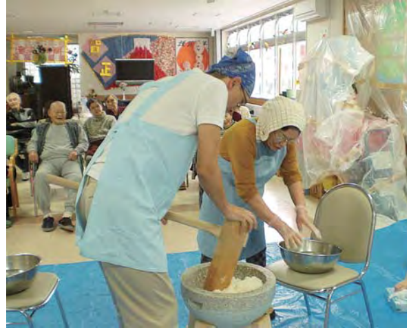
お正月の餅つきの様子です!