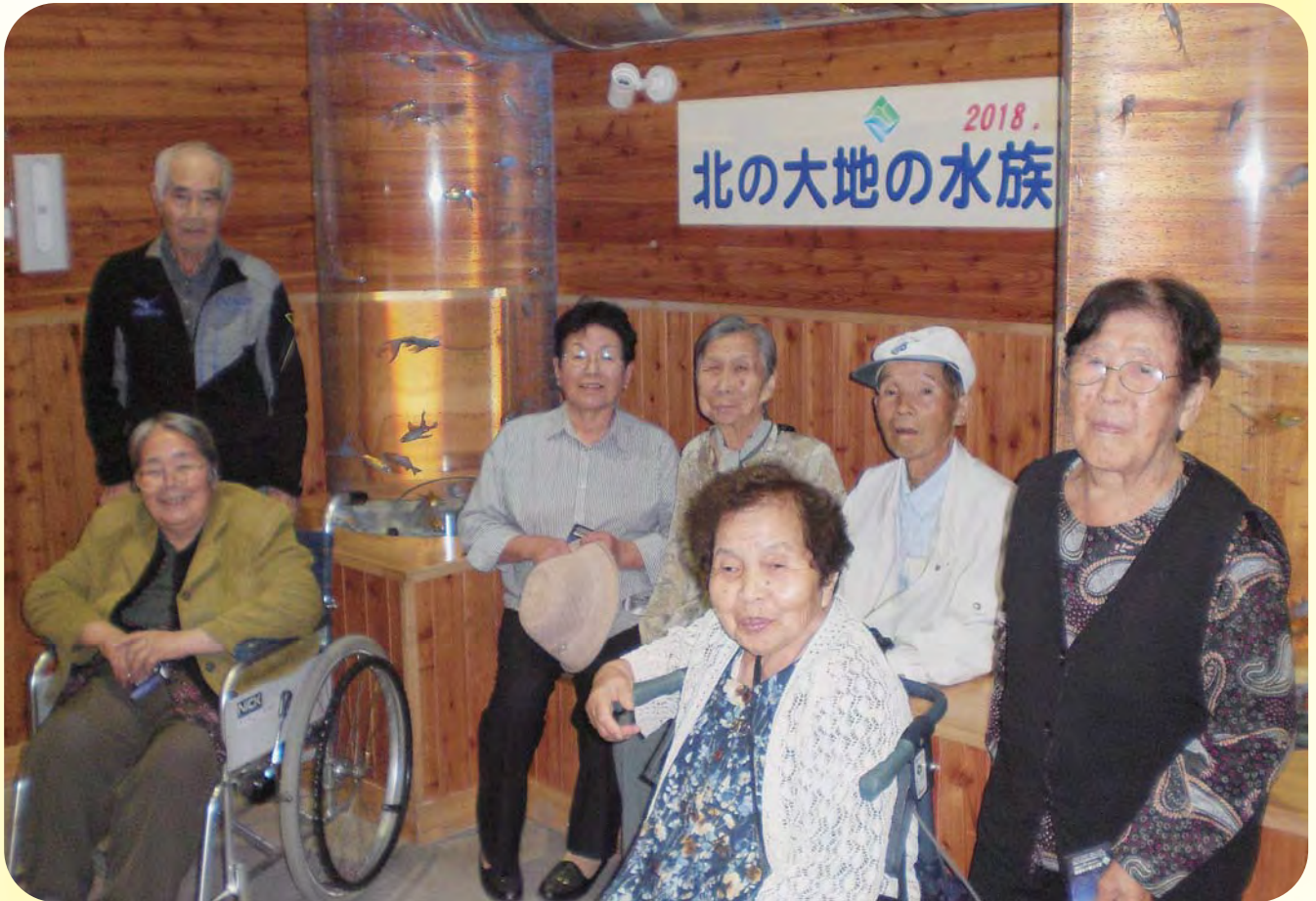
山の水族館見学（デイサービスセンター）

社会福祉法人 丸瀬布社会福祉協会 北海道紋別郡遠軽町丸瀬布新町404番地 TEL0158-47-3001 FAX0158-47-3002