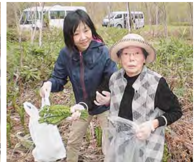
山菜採りもしています