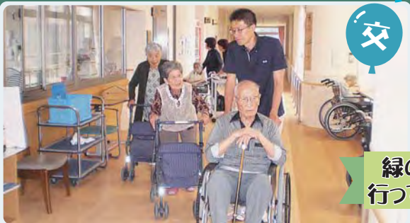
緑の園に遊びに行ってきましたあ!!