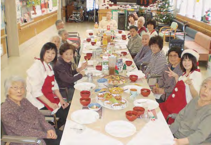
ごちそうを囲んでのX'mas会♪